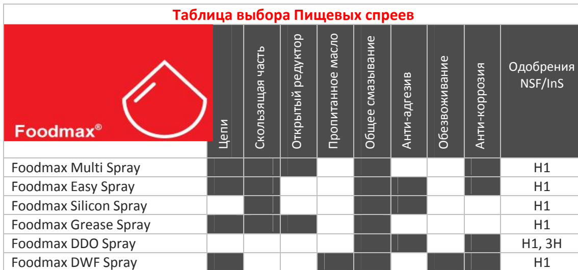
Таблица выбора Пищевых спреев

All performance data on this Technical Info Sheet are indicative only and can vary during production